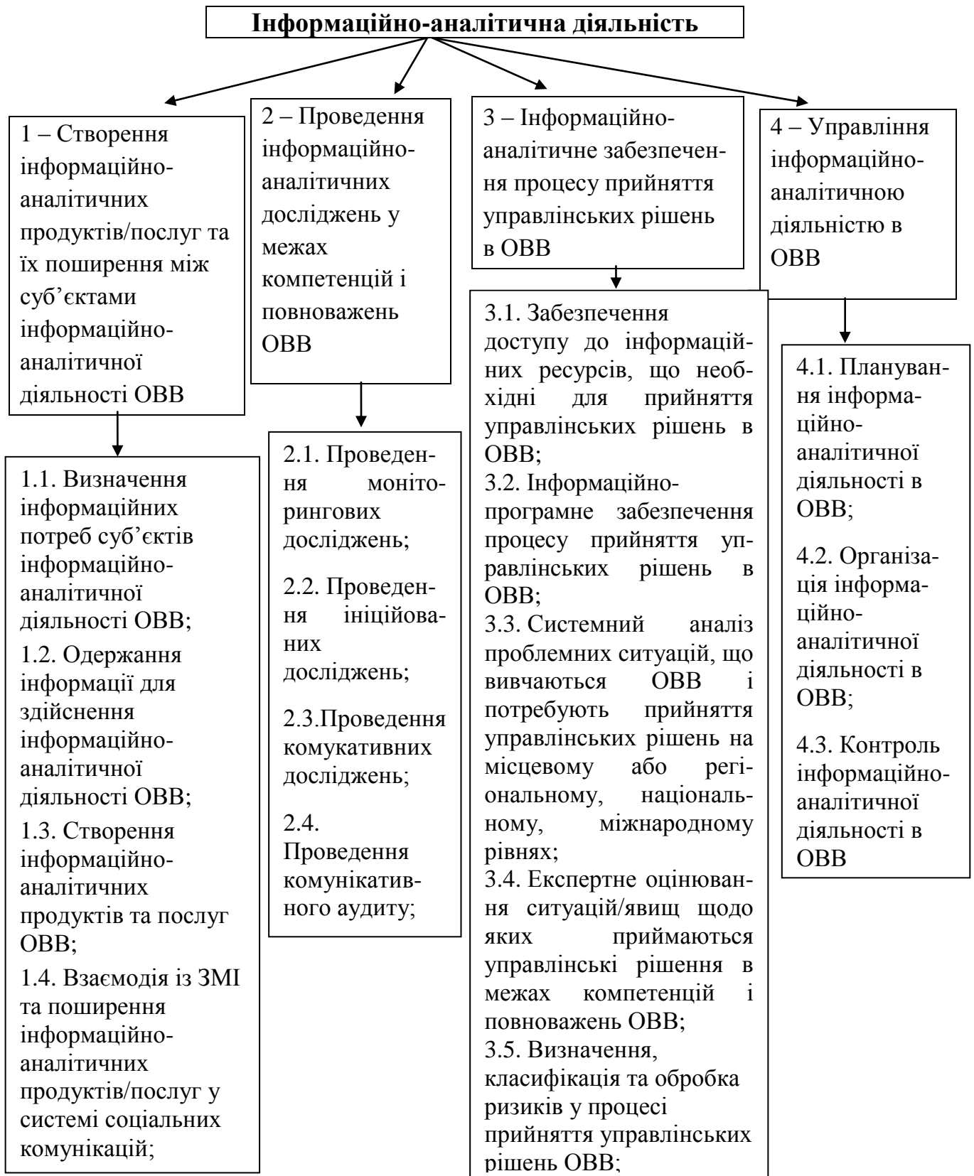
Рис. 2. Структура декомпозиції робіт у сфері інформаційно-аналітичної діяльності органів виконавчої влади методом WBS.

Пакет 2. Проведення інформаційно-аналітичних досліджень (субпакети: 2.1. Системний аналіз ситуацій; 2.2. Моніторингові дослідження; 2.3. Ініційовані дослідження; 2.4. Комунікативний аудит).