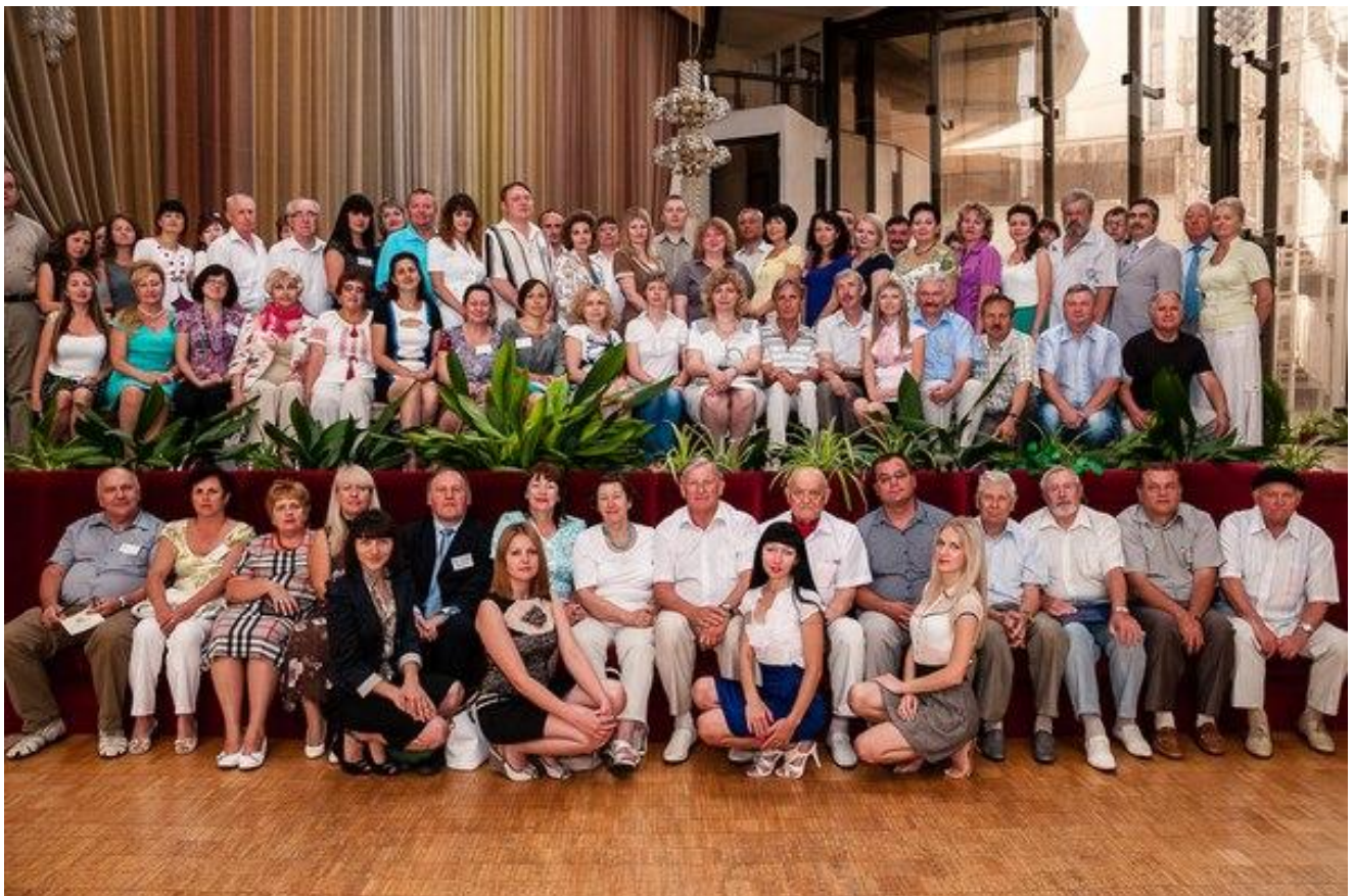
Рис. 5. Участники Международной научно-практической конференции «Ольвийский форум-2013: Стратегии развития причерноморского региона», организованной ЧГУ имени Петра Могилы (Ялта, Украина, июнь 2013 г.)