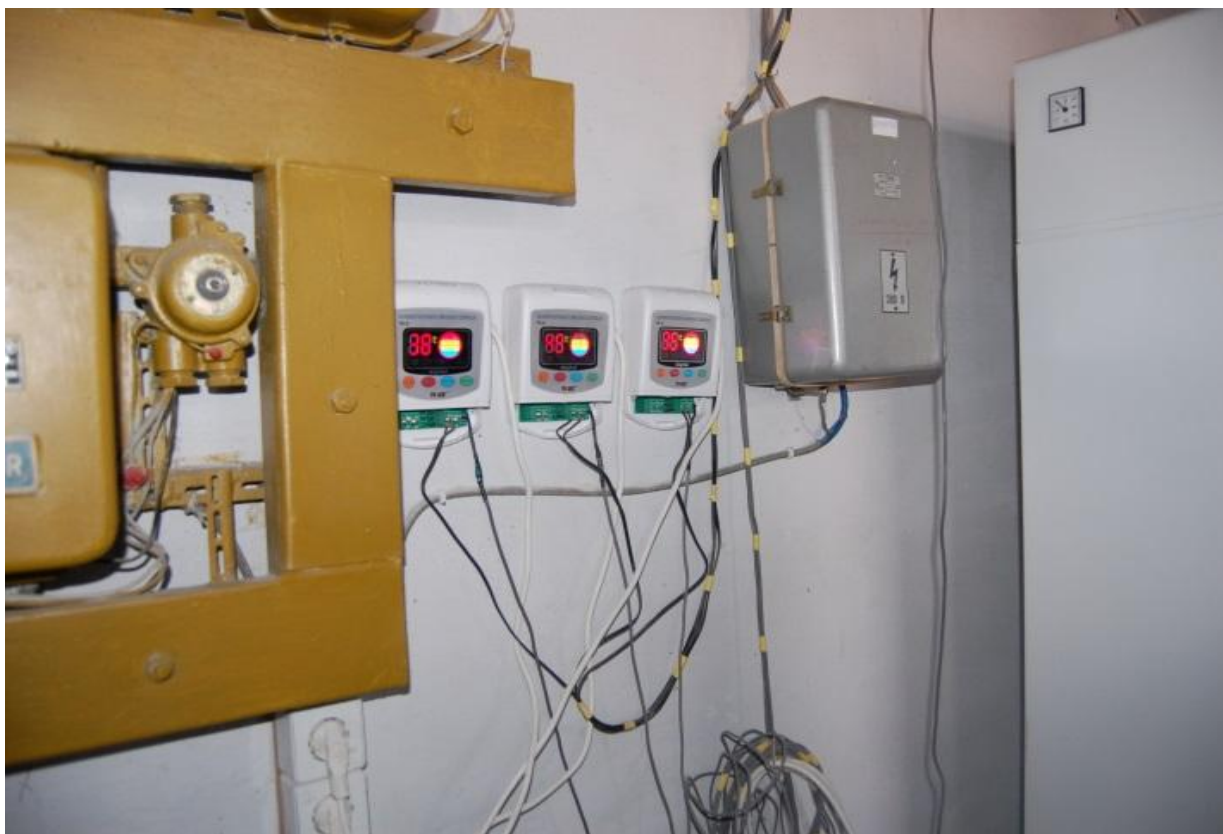
Рис. 3. Датчики работы гелиосистемы.