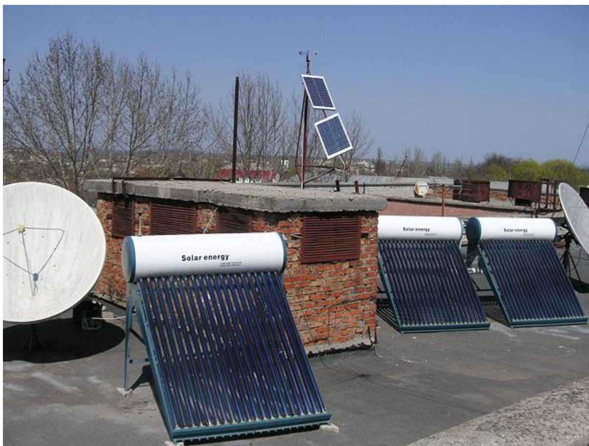
Рис. 1. Экспериментальная гелиосистема Черноморского государственного университета имени Петра Могилы.